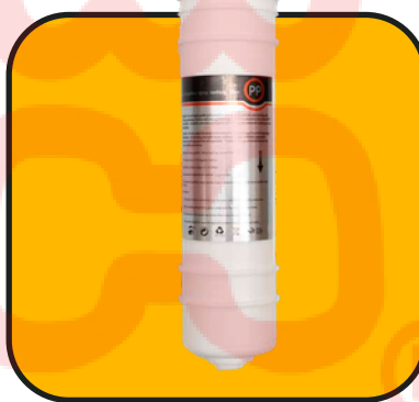
Filtro de polipropileno