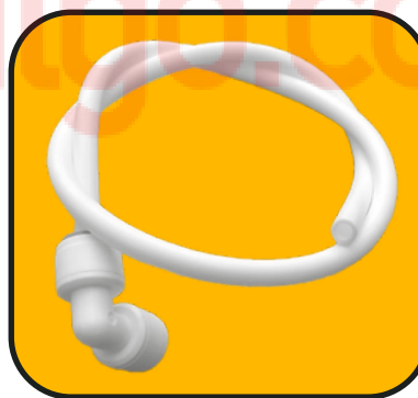
Manguera corta 54 cm de 1/4" con codo