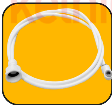
Manguera larga 152 cm de 1/4" con codo y conector hembra de 1/2"