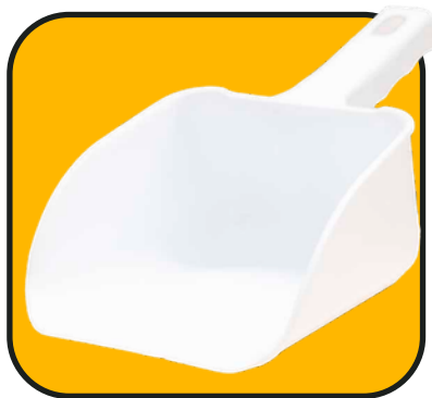
Pala de plástico